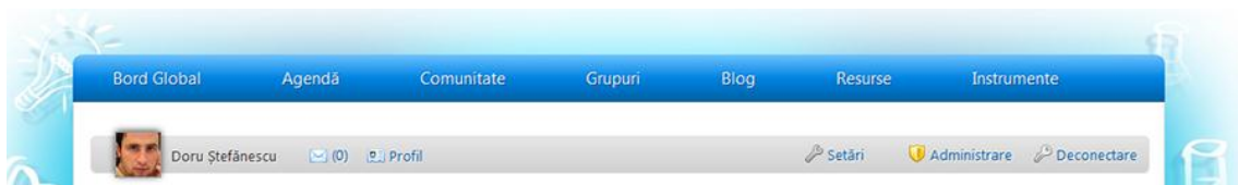
Fig.2 Bara de instrumente

Pentru a completa sau modifica profilul, se accesează butonul Profil din bara de instrumente.