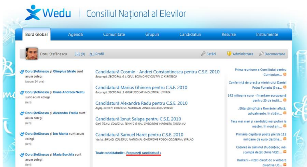
Fig 5. Bordul global și poziția legăturii "Propuneți candidatură".

Pentru a depune o candidatură, utilizatorul trebuie să acceseze legătura “Propuneți candidatură” , ce se găsește pe bordul global , sub lista de candidaturi existente pe platforma Wedu sau accesând următoarea legătură: http://wedu.ro/pg/candidaturi/propune-candidatura