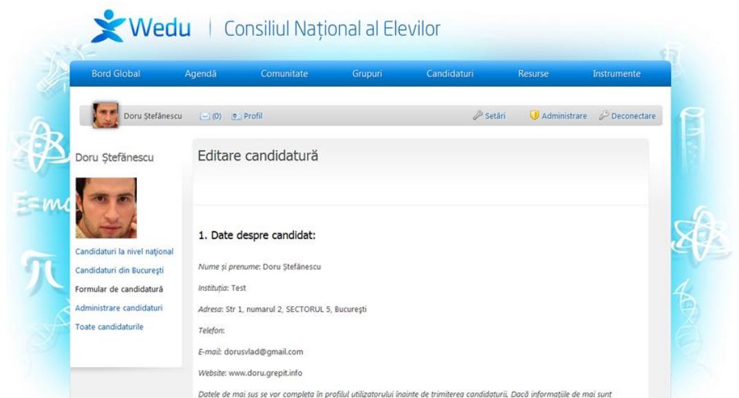
Fig 6. Formularul de candidatură - modificarea acestuia.

Pentru depunerea unei candidaturi, utilizatorul va completa formularul de candidatură cu cât mai multe detalii solicitate. Pentru o candidatură completă, utilizatorul va trebui să actualizeze profilul său cât mai complet posibil.